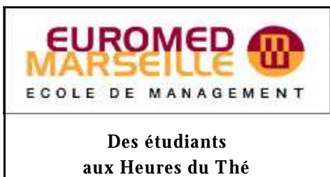
Des étudiants aux Heures du Thé

Le CNIPAL s'est produit le 2 Juin dernier en concert au Théâtre du Pin Galant à Mérignac, près de Bordeaux. Cette salle moderne accueille tout au long de l'année une programmation diversifiée dont plusieurs productions lyriques. Pour cette première venue des Solistes du CNIPAL, ce sont plus de 1200 personnes qui se sont déplacées pour découvrir et écouter nos Pensionnaires. Le programme, conçu comme un "Hommage aux Compositeurs", a permis au public girondin d'entendre des ensembles extraits du répertoire traditionnel tels que La Fille du Régiment , L'Elisir d'Amore , Don Pasquale , Les Pêcheurs de Perles , Eugène Oneguine , ou plus rarement interprété : Mosé , Sniegourotchka , Le Comte Ory accompagné au piano par Nino PAVLENICHVILI. La mise en espace a été confiée à Gérard-Michaël BOHBOT. Fort du succès de cette soirée, Jean-Paul Burle, Directeur du Pin Galant, a d'ores et déjà réinvité le CNIPAL dans le cadre de la programmation 2009/2010. Ce concert qui s'ajoute au récital programmé en mars dernier à l'Opéra National de Bordeaux, vient conforter le rayonnement du CNIPAL en terre girondine.