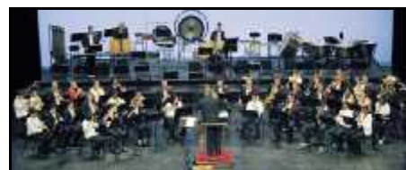
Concerto de GLIERE avec l'Orchestre d'Harmonie des Gardiens de la Paix