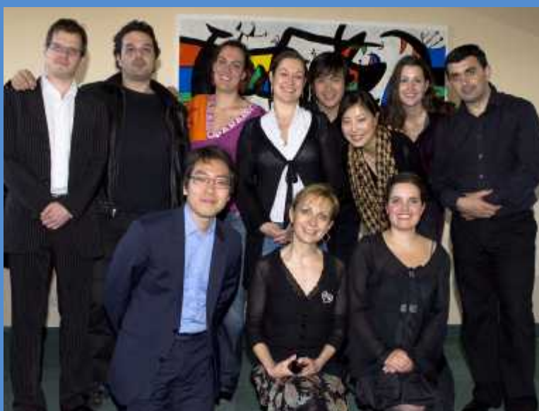
La Promotion Natalie DESSAY en compagnie de sa marraine

Après Barbara HENDRICKS, June ANDERSON, Roberto ALAGNA, Rolando VILLAZON, Michel PLASSON... c'est Natalie DESSAY que les Solistes du CNIPAL ont eu la joie d'accueillir dans le cadre des Rencontres Master. La Marraine de la Promotion a écouté chacun lors d'une audition et en a profité pour prodiguer individuellement de précieux conseils, nourris d'un fort enthousiasme, d'une énergie et une lucidité. En témoignent d'ailleurs les photos de la Soprano française en pleine action. Cette rencontre a également donné l'opportunité aux Solistes du CNIPAL de partager avec notre ambassadrice lyrique leurs interrogations, leurs craintes, leurs envies et leur passion. Sans oublier la photo souvenir et le livre d'or qui terminent cette journée d'une grande richesse tant humaine qu'artistique.